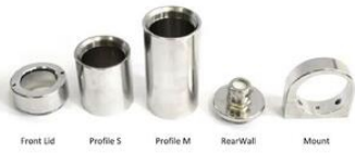
Front Lid Profile S Profile M Rear Wall Mount