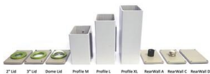
2" Lid 3" Lid Dome Lid Profile M Profile L Profile XL RearWall A RearWall C RearWall D

Order Numbers (please specify the camera type for each order!):