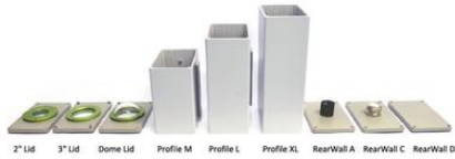
2" Lid 3" Lid Dome Lid Profile M Profile L Profile XL RearWall A RearWall C RearWall D

Order Numbers (please specify the camera type for each order!):